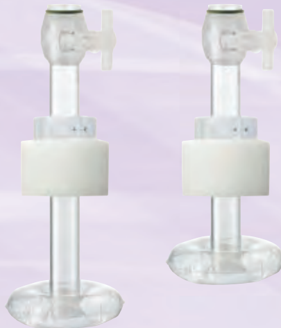
UROリングアンカー バルーン