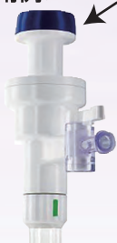
ディスポーザブル