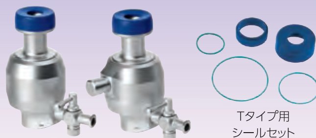
Tタイプ用 シールセット