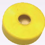
シーリングキャップ 8mm