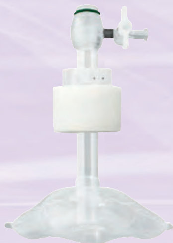
ストラクチュアル バルーン