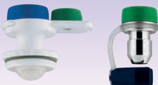
ディスポーザブル